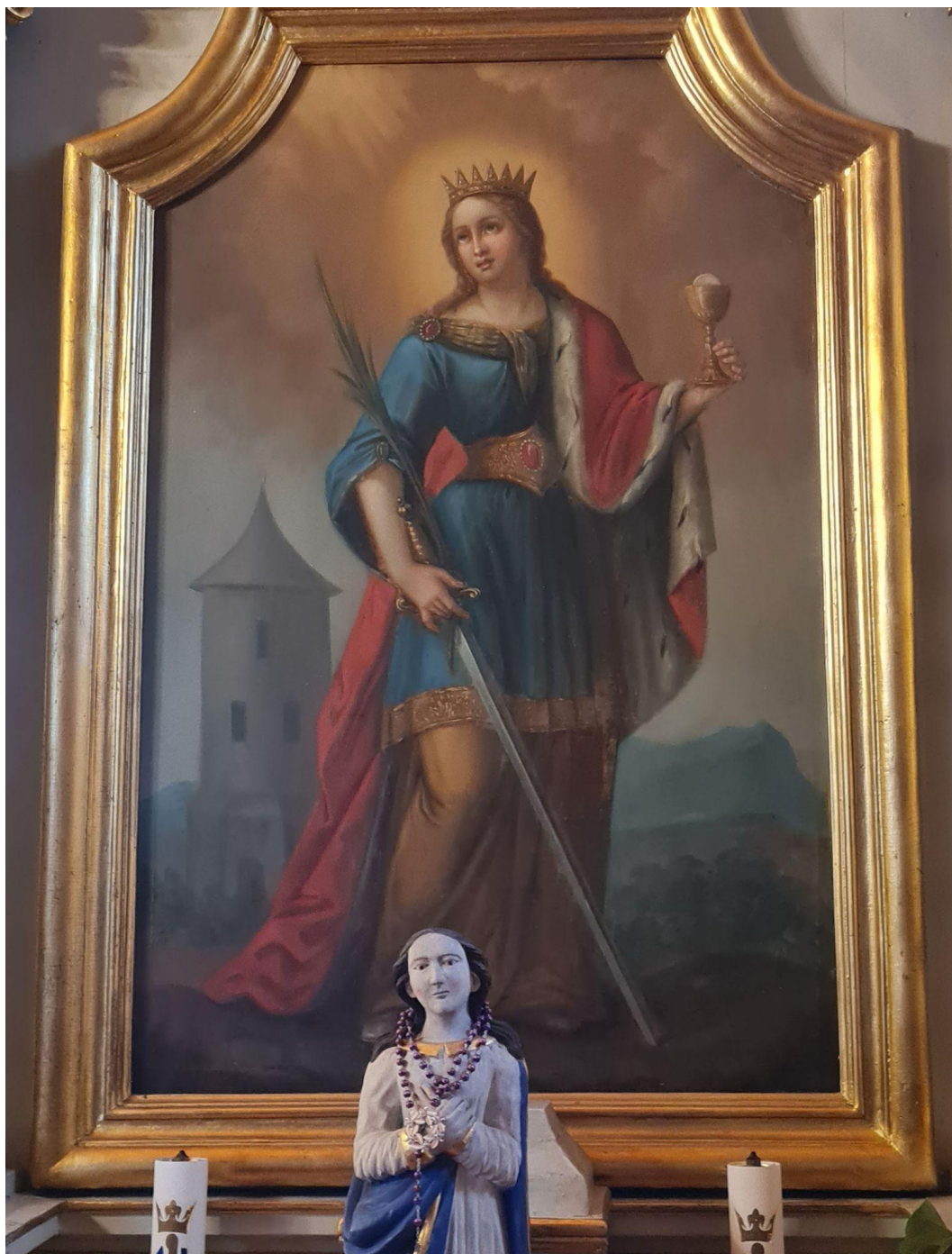
Fot. 8. Kościół Zwiastowania Najświętszej Maryi Panny w Pleckiej Dąbrowie. Ołtarz boczny p.w. św. Barbary. Obraz św. Barbara. Przed konserwacją.