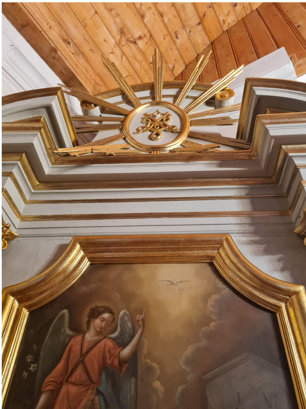
Fot. 13. Kościół Zwiastowania Najświętszej Maryi Panny w Pleckiej Dąbrowie. Ołtarz boczny p.w. Zwiastowania. Przed konserwacją. Fot. M. Kwiatkowska, 2021 r..