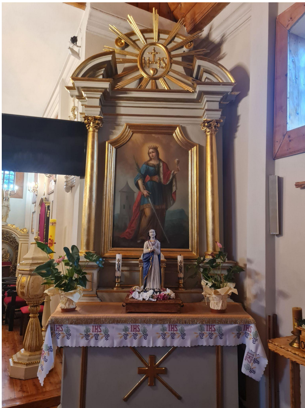
Fot. 7. Kościół Zwiastowania Najświętszej Maryi Panny w Pleckiej Dąbrowie. Ołtarz boczny p.w. św. Barbary. Przed konserwacją.