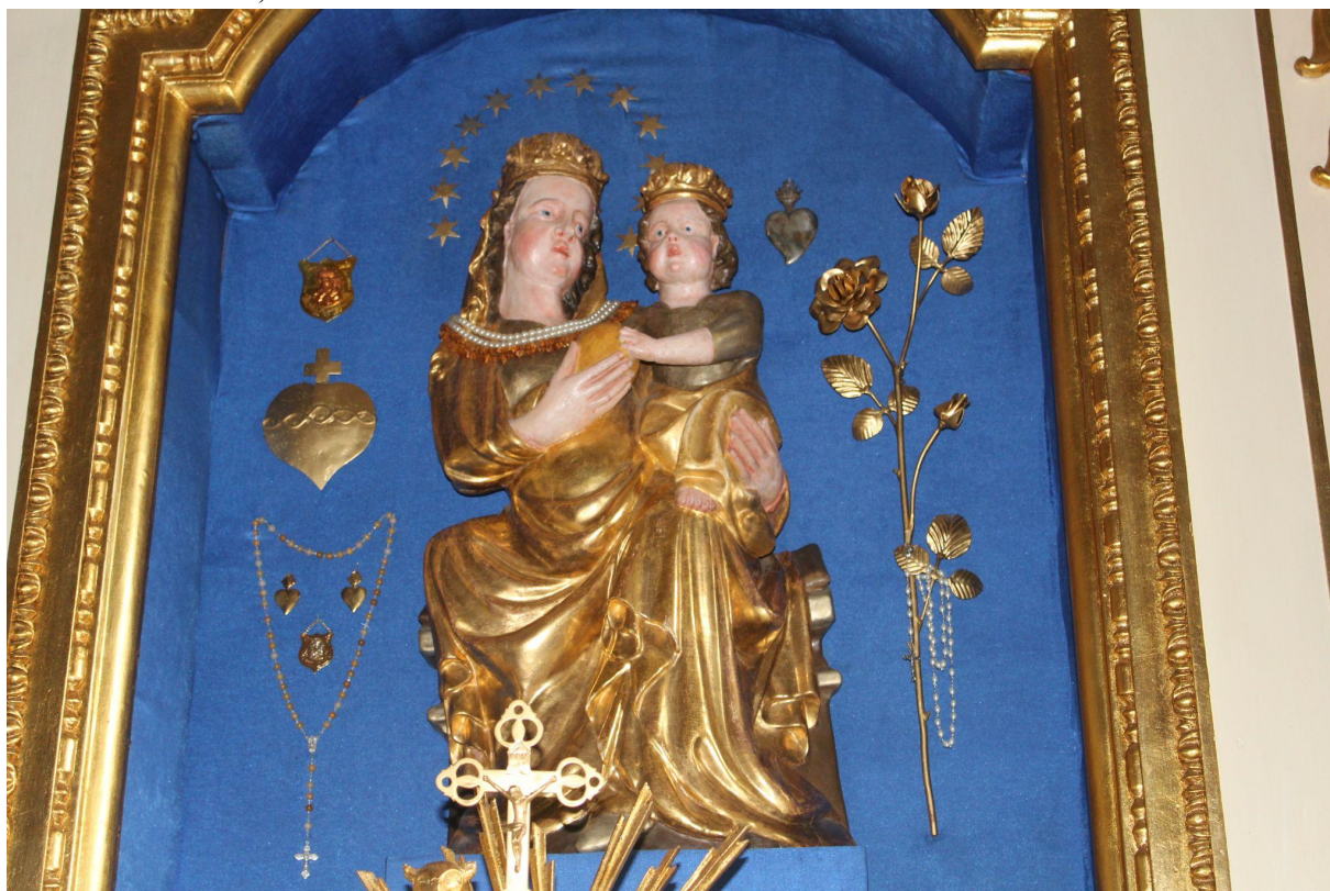
Fot. 4. Kościół Zwiastowania Najświętszej Maryi Panny w Pleckiej Dąbrowie. Ołtarz główny. Przed konserwacją. Fot. M. Kwiatkowska, 2021 r.