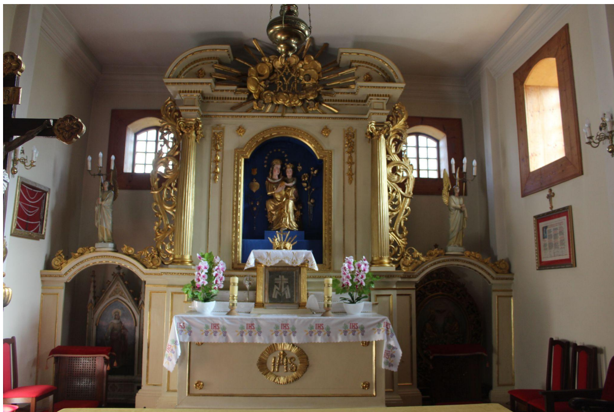
Fot. 3. Kościół Zwiastowania Najświętszej Maryi Panny w Pleckiej Dąbrowie. Ołtarz główny. Przed konserwacją. Fot. M. Kwiatkowska, 2021 r.