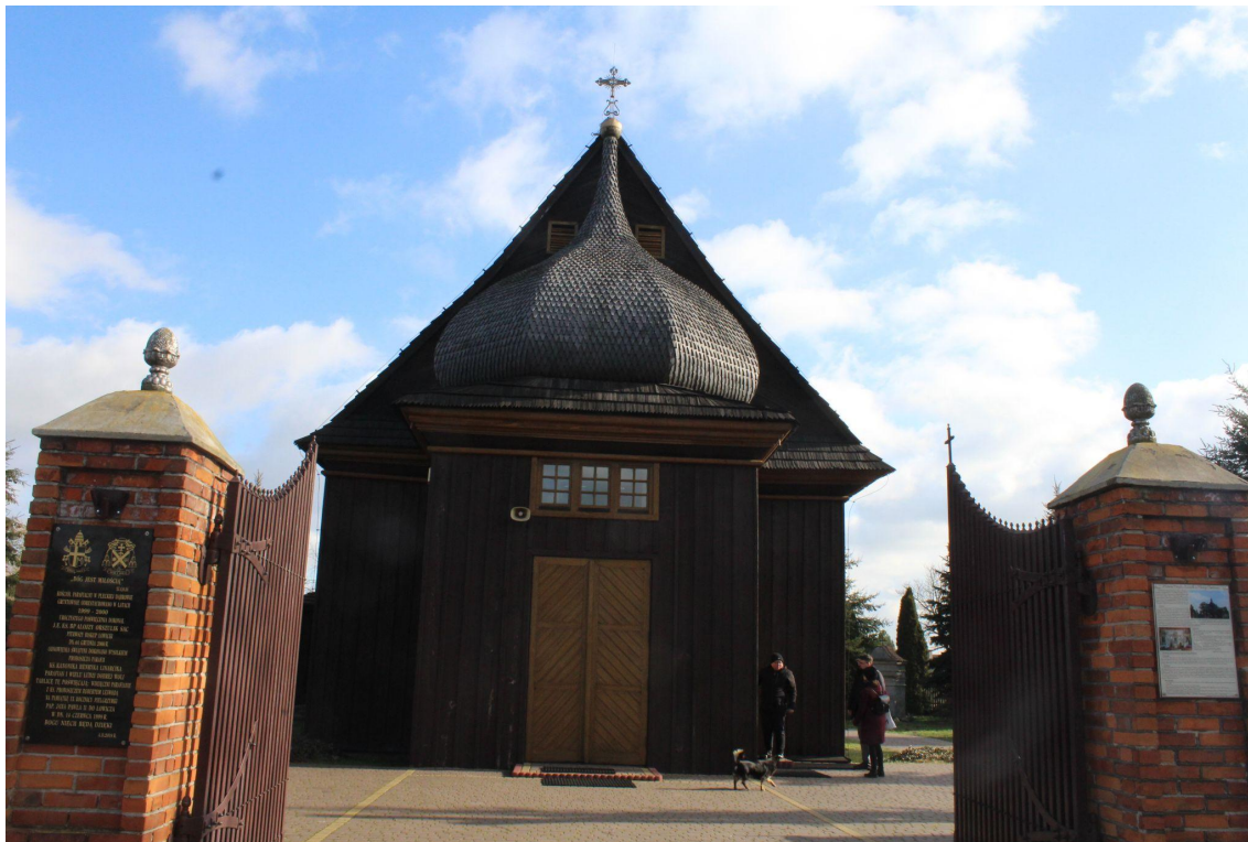
Fot. 1. Kościół Zwiastowania Najświętszej Maryi Panny w Pleckiej Dąbrowie Widok ogólny. Fot. Krzysztof Jończyk, 2020.