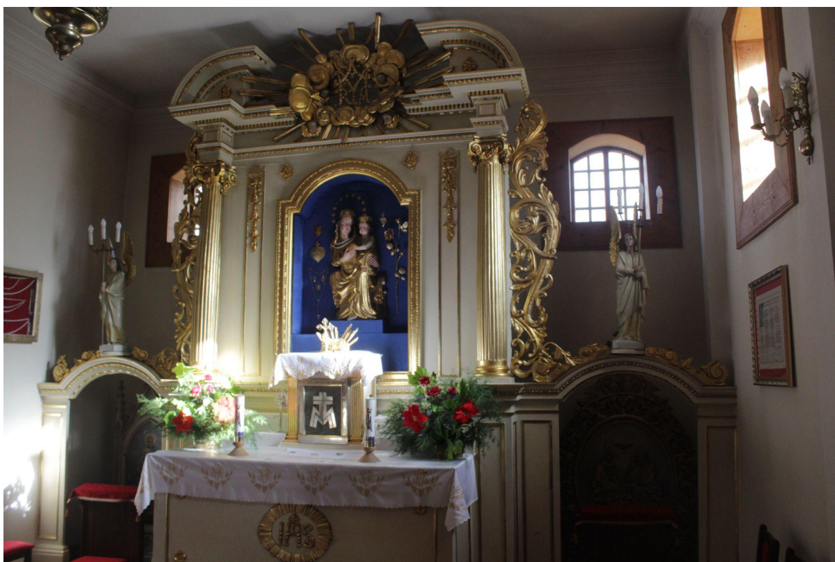
Fot. 2. Kościół Zwiastowania Najświętszej Maryi Panny w Pleckiej Dąbrowie. Ołtarz główny.