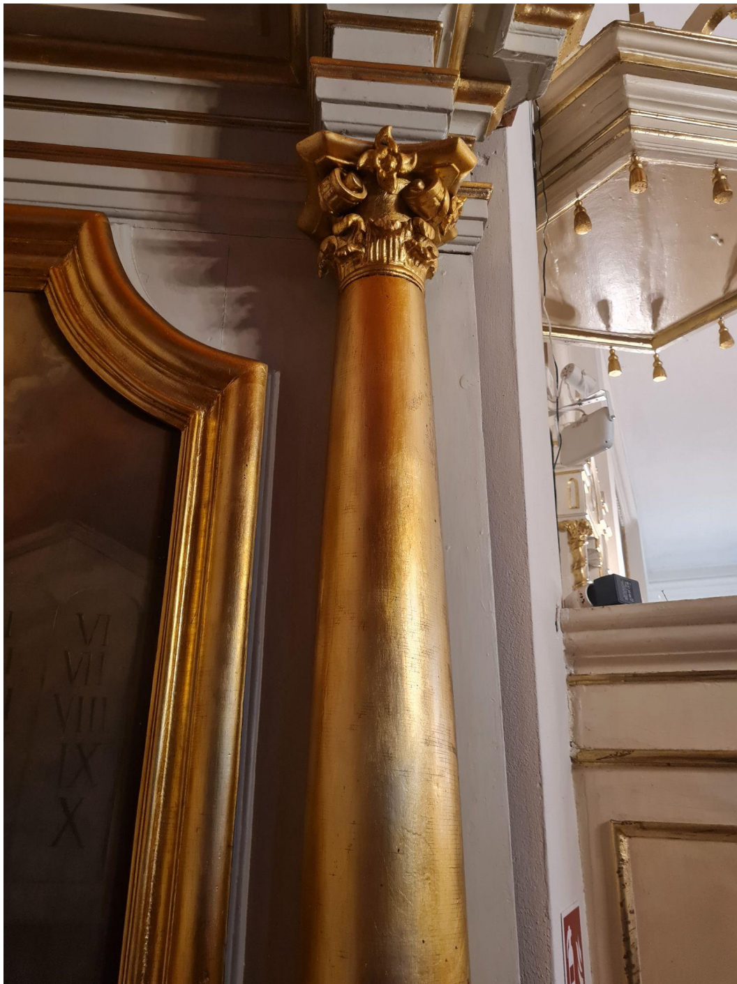
Fot. 14. Kościół Zwiastowania Najświętszej Maryi Panny w Pleckiej Dąbrowie. Ołtarz boczny p.w. Zwiastowania. Przed konserwacją. Bazy kolumn przed konserwacją. Widoczne przeżłocenia szlagmetalem.