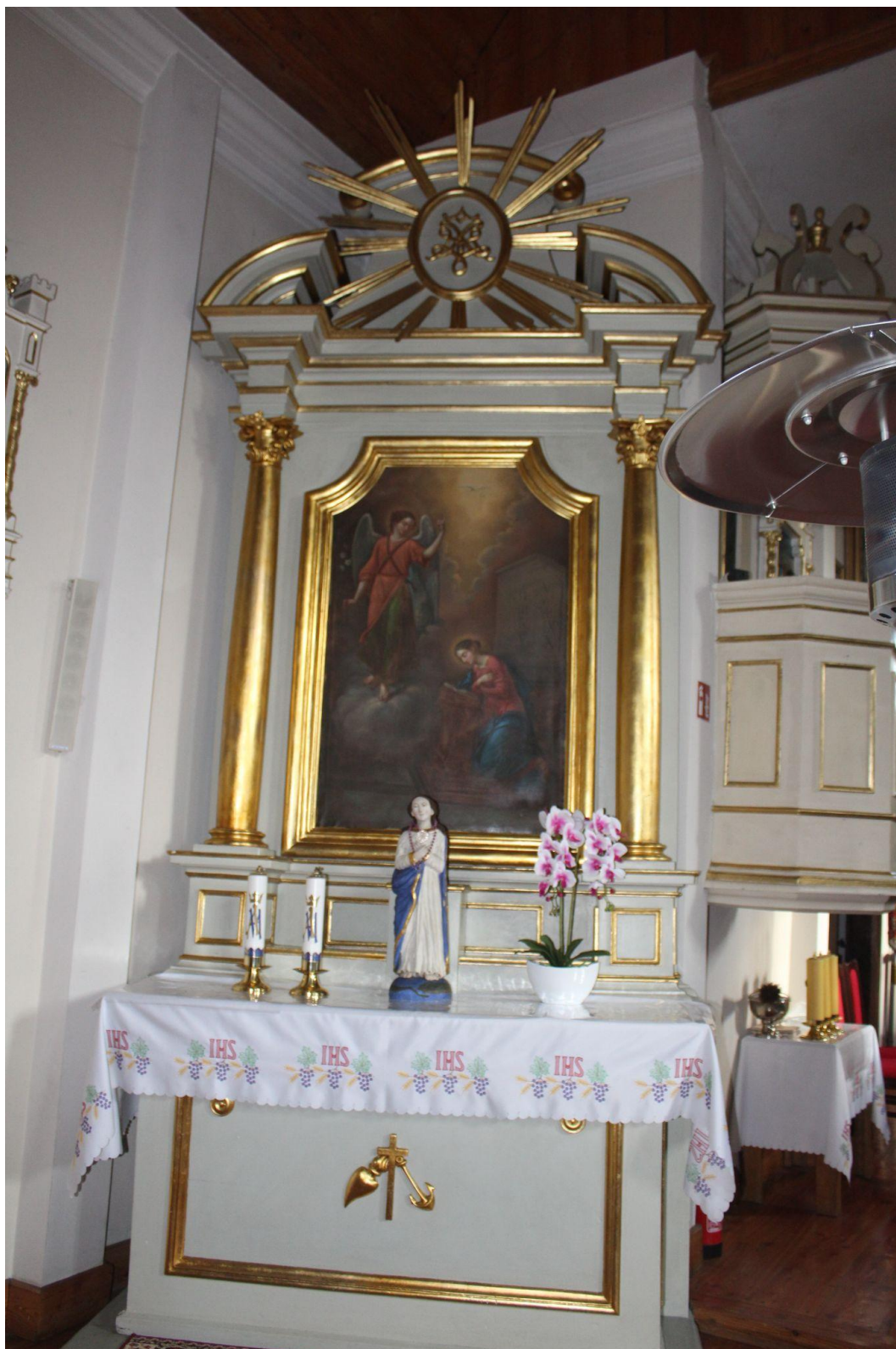
Fot. 11. Kościół Zwiastowania Najświętszej Maryi Panny w Pleckiej Dąbrowie. Ołtarz boczny p.w. Zwiastowania. Przed konserwacją.