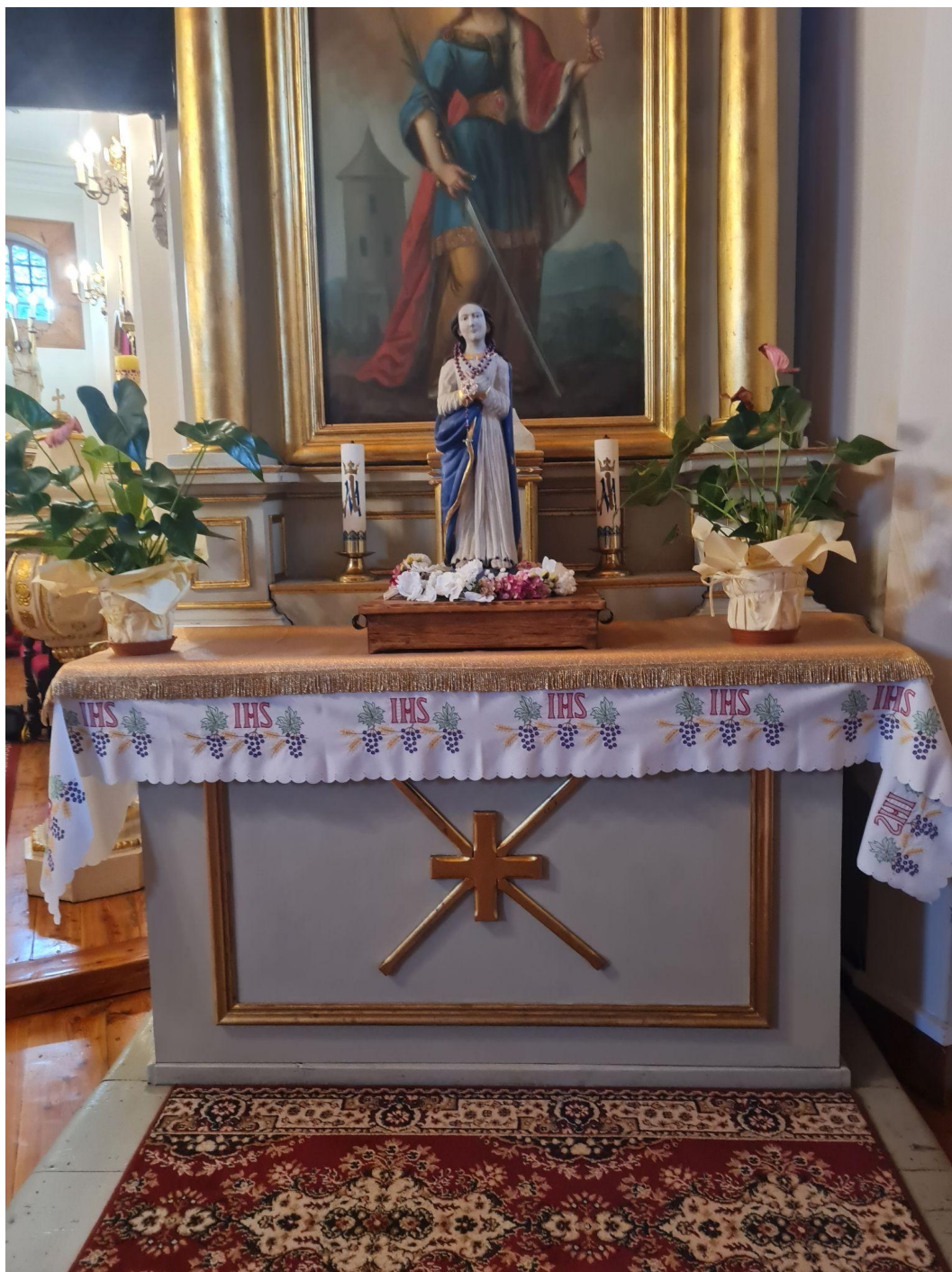
Fot. 9. Kościół Zwiastowania Najświętszej Maryi Panny w Pleckiej Dąbrowie. Ołtarz boczny p.w. św. Barbary. Przed konserwacją. Fot. M. Kwiatkowska, 2021 r.