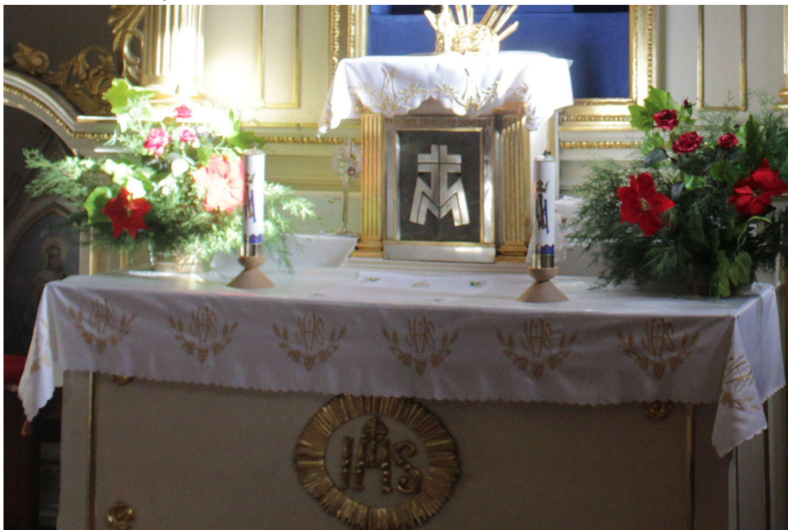
Fot. 6. Kościół Zwiastowania Najświętszej Maryi Panny w Pleckiej Dąbrowie. Ołtarz główny. Przed konserwacją. Fot. M. Kwiatkowska, 2021 r.