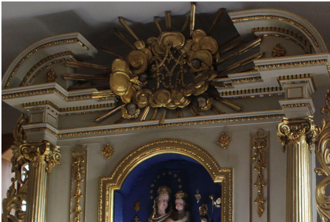
Fot. 5. Kościół Zwiastowania Najświętszej Maryi Panny w Pleckiej Dąbrowie. Ołtarz główny. Przed konserwacją. Fot. M. Kwiatkowska, 2021 r.