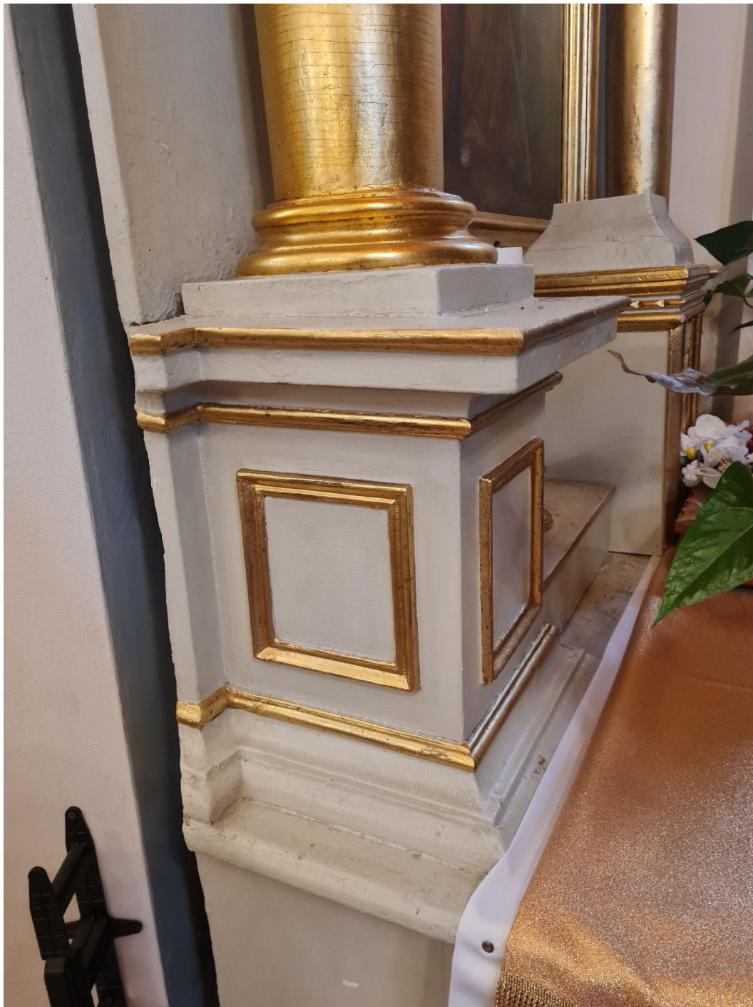
Fot. 10. Kościół Zwiastowania Najświętszej Maryi Panny w Pleckiej Dąbrowie. Ołtarz boczny p.w. św. Barbary. Przed konserwacją. Fot. M. Kwiatkowska, 2021 r.